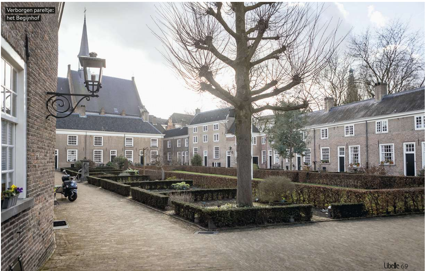
Verborgен paelkje: het Begijnhof