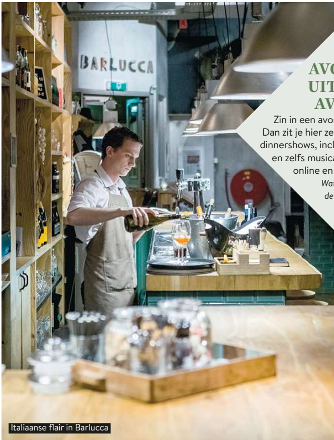
Italiaanse flair in Barlucca