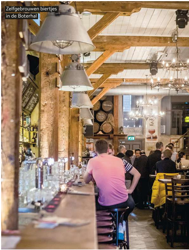
Zelfgebrouwen biertjes in de Boterhal