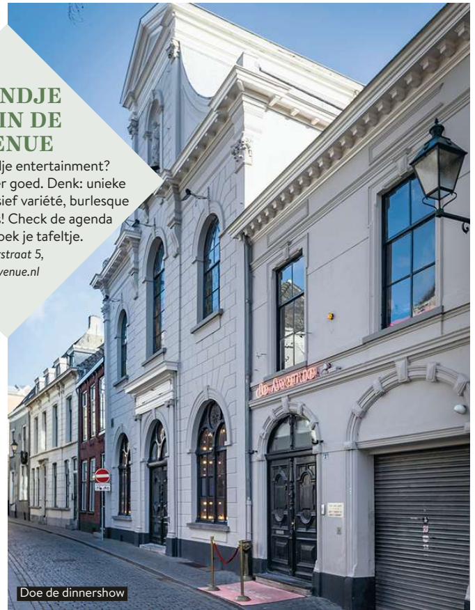
Doe de dinnershow

Zin in een avondje entertainment? Dan zit je hier zeker goed. Denk: unieke dinnershows, inclusief variëteit, burlesque en zelfs musicals! Check de agenda online en boek je tafeltje. Waterstraat 5, de-avenue.nl