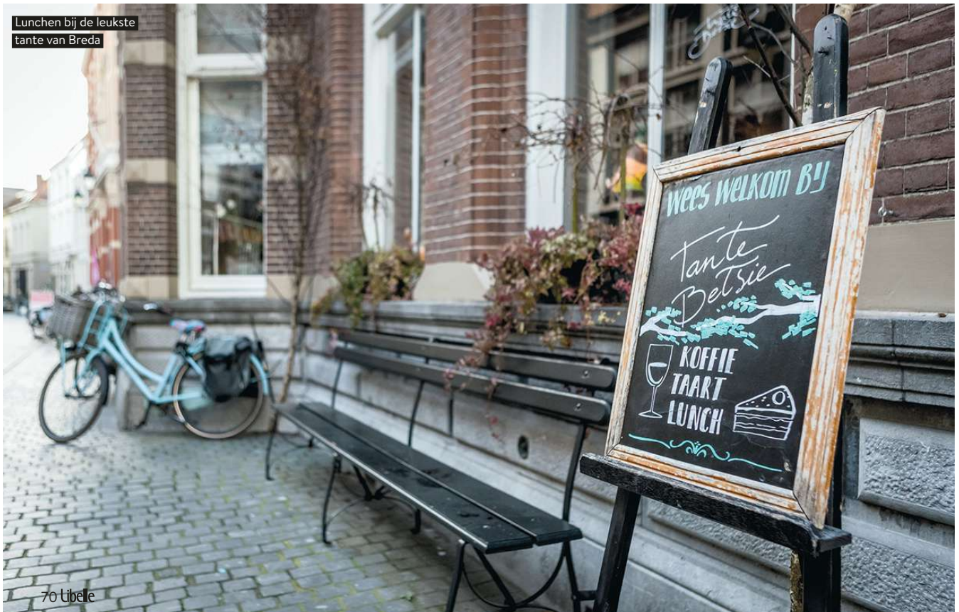
Lunchen bij de leukste tante van Breda